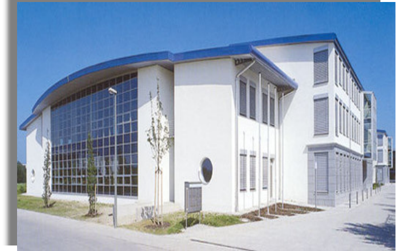
CLC – Commercial Logistic Center Hallbergmoos, nahe des Münchener Flughafens